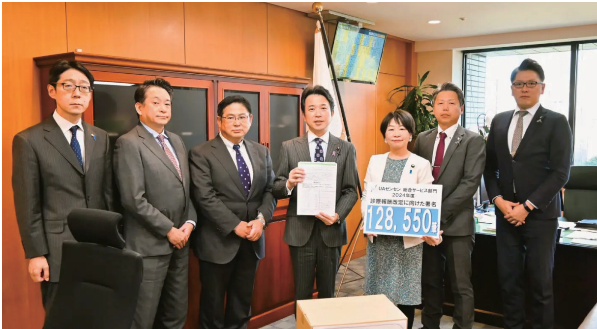
(中央から) 濱地雅一副大臣、田村まみ議員

2023年11月14日、UAゼンセンは、厚生労働省を訪問。UAゼンセン総合サービス部門が呼びかけた医療従事者の処遇改善を求める「診療報酬改定へ向けた署名」128,550筆を、濱地雅一副大臣に手交。診療報酬改定において医療従事者の処遇改善を実現することを求めました。